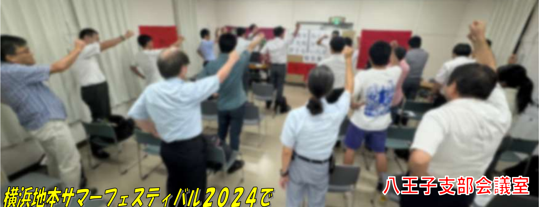
八王子支部会議室